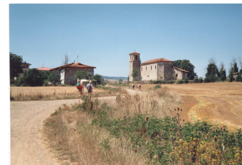
Pèlerins sur le chemin à Villambistia

Aujourd'hui, il compte encore parmi les trois grands pèlerinages de la Chrétienté, mais est surtout devenu une randonnée célèbre, où les marcheurs croisent les amateurs d'art roman. On s'y rend à pied ou à vélo, parfois même à cheval ou avec son âne.